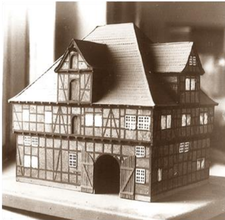
Die alte Ratswaage - 1860

Später ging das Gebäude in den Besitz der Stadt über, welche die preußischen Truppen in die Ratswaage einziehen ließ. So entstand an dieser Stelle eine Kaserne. 1900 reichte der Platz für die Pioniere nicht mehr aus und es hielt ein Postamt Einzug.