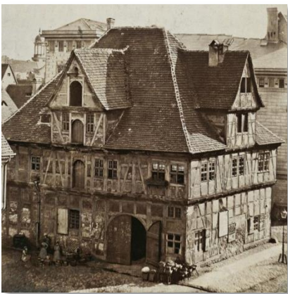
Die alte Ratswaage - Stadtarchiv

Kurz darauf ging das Gebäude in den Besitz der Stadt Magdeburg über, welche die preußischen Truppen in die Ratswaage einquartierten. So entstand an dieser Stelle eine Kaserne. 1900 war ein Umzug aufgrund des Platzmangels unumgänglich und es hielt das Postamt Nr. 4 Einzug.