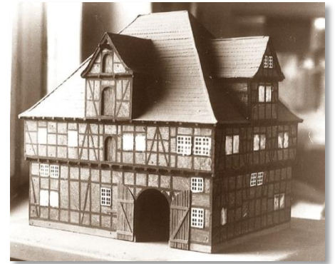
Die alte Ratswaage 1860

Ab 1330 wurde die Ratswaage als Innungshaus der Bäcker und Brauer genutzt. Während des Dreißigjährigen Krieges brannte das Gebäude im Mai 1631 ab. 1657 wurde das Gebäude rekonstruiert und später mit einem Wappenstein der Bäcker- und Brauerinnung versehen, welcher noch heute an der Fassade zu sehen ist.