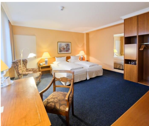
Doppelzimmer 2023

Dieses Jahr – 2024 – feiern wir unser 30-jähriges Bestehen und blicken mit Stolz auf unsere Geschichte zurück. An dieser Stelle möchten wir uns herzlich für Ihre langjährige Treue bedanken. Ihre Unterstützung hat uns zu dem gemacht, was wir heute sind. Auf viele weitere gemeinsame Jahre voller unvergesslicher Momente!