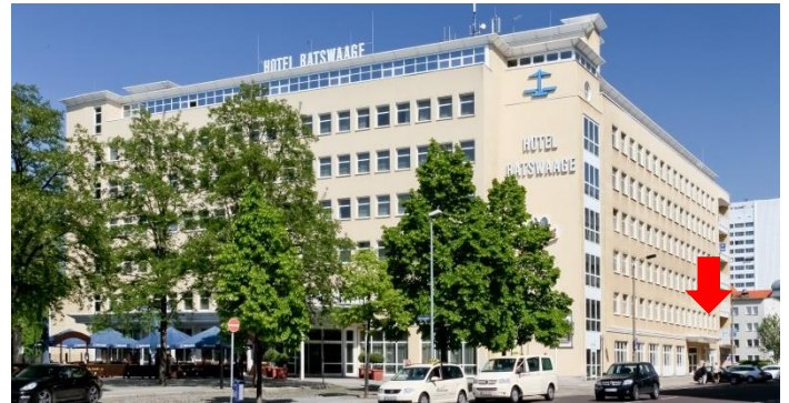
Hotel Ratswaage in Magdeburg